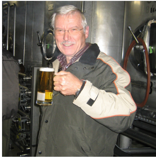
Der erste Schluck aus dem Tank – das schmeckt ja gar nicht schlecht.