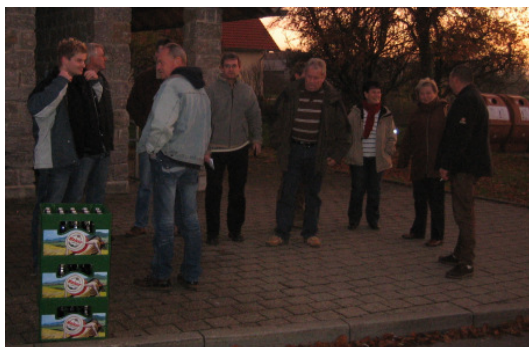
Gespanntes warten auf den Bus