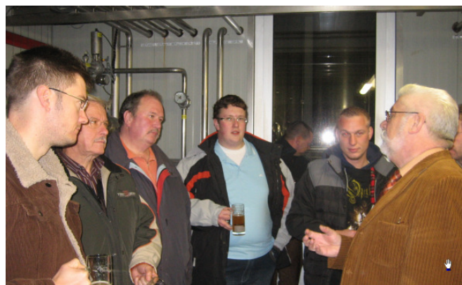
Alles wurde hervorragend erklärt.