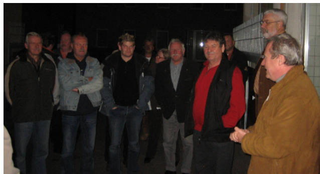
Herzliche Begrüßung durch den Chef