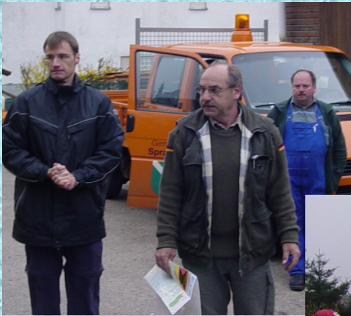
Einteilung am Morgen