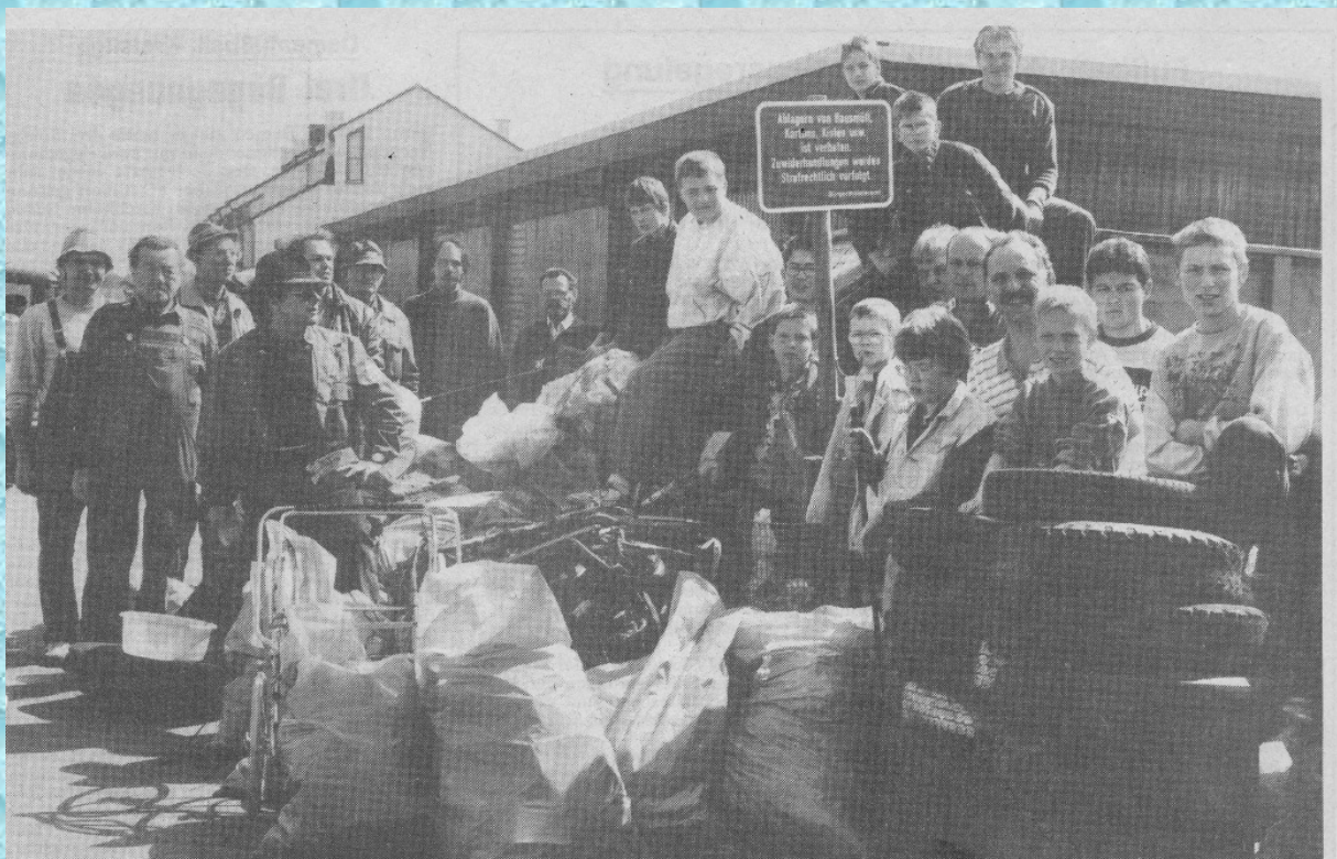
Frühjahrsputzete des Spraitbacher Fischereivereins.

So gewappnet ging es an die Organisation und Durchführung.