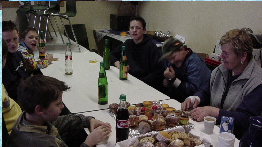
Buban greifts zu.