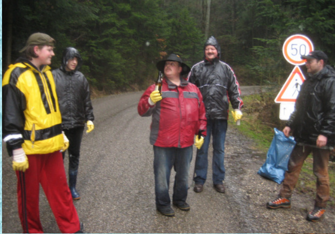
Der Regen strömte